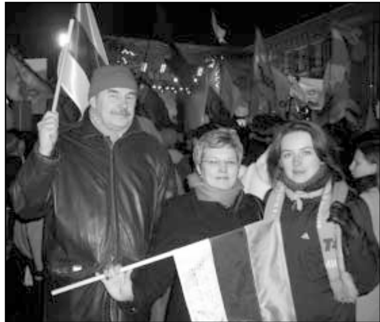
Kiievis valimiste viimase voo öhtul 26. detsembril, kui oli selge, et Viktor Juštšenko võitis.

Præguseks on näiteks Ukraina otsustavalt väljendanud oma tahet liituda euroliiduga. See loob Ukraina võimukandjatele ja kodanikuühendustele uue sihi – selgitada rahvale juba varakult ELi olemust ja liitumishoovust, samuti liidus avanevaid võimalusi. Kasvõi selles osas